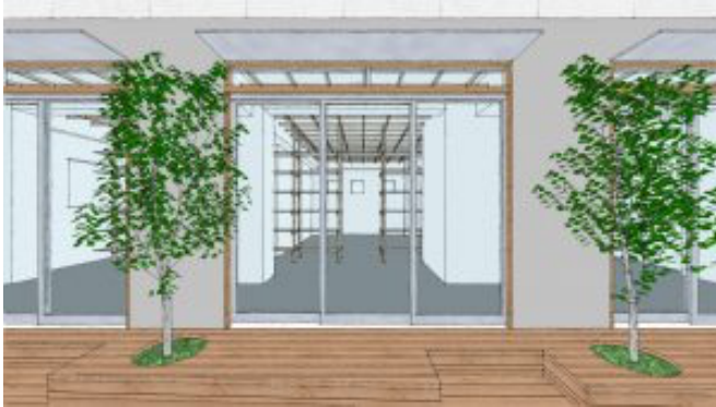
※改装後のイメージ